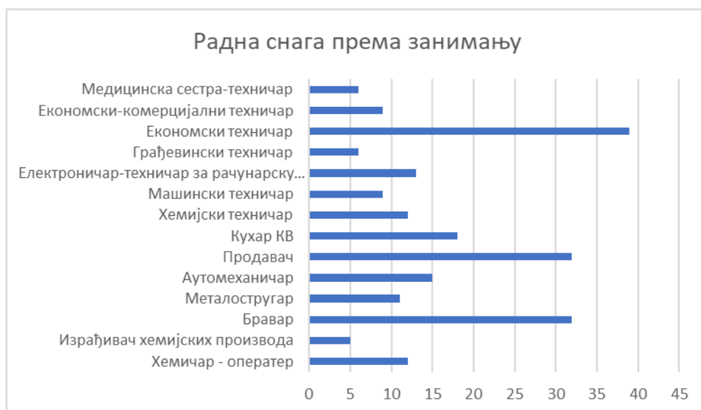
Дијаграм бр.1: Број незапослених према занимању