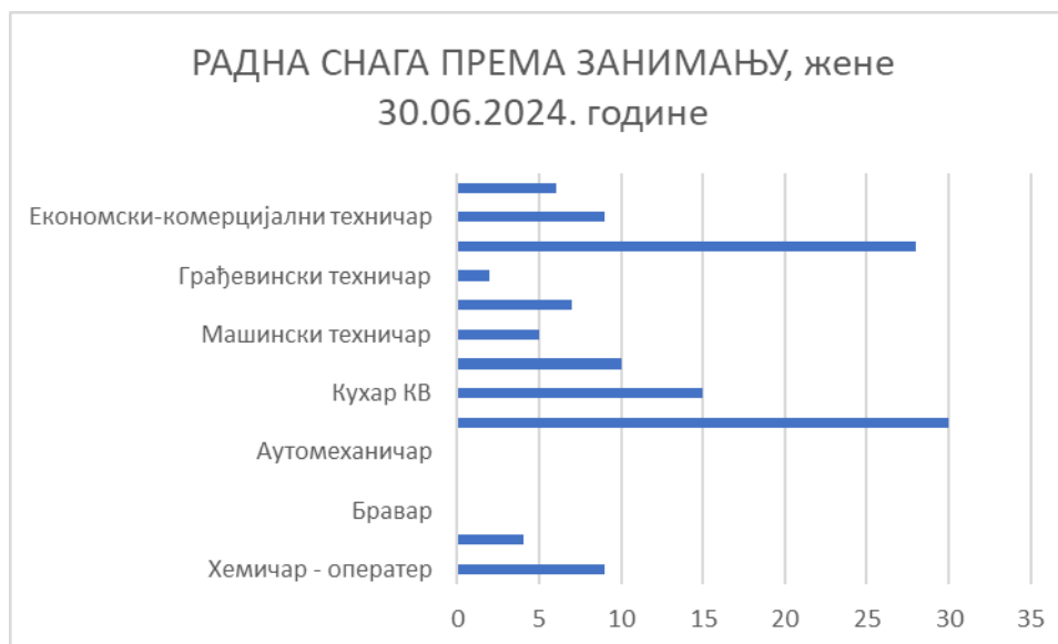
Дијаграм бр.2: Број незапослених према занимању, жене