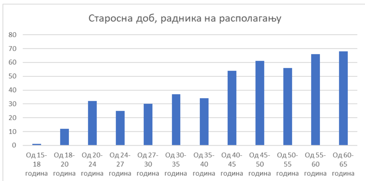
Дијаграм бр.4: Расположена радна снага према старосној структури